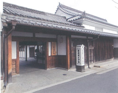
旧家は、「讃岐井筒屋敷」として観光施設となっています。

讃岐井筒屋は、江戸時代初期一六九二年、(元禄五年)醤油造として讃州(現香川県)にて創業。讃州は良質な小麦、瀬戸内の塩など、原料の確保に最適な土地といふこともあり一九〇〇年代に入り、手延べ麵製造を開始。伝統の手延べ製法を伝承しつつ、即席麵技術の特許取得など時代と共に技術革新にも取り組む、讃岐の歴史と風土とともに、手延べの美味しさをみなさまにお届けする商品を作り続けております。